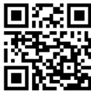
Plakat „So forschen wir in Mathe“