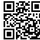
Handreichung „Sprachbildung im Mathematikunterricht“ (erscheint demnächst)