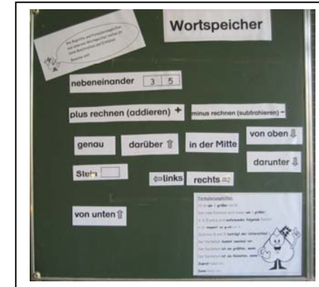
Wortspeicher zur 2. Unterrichtseinheit (S.5/6)