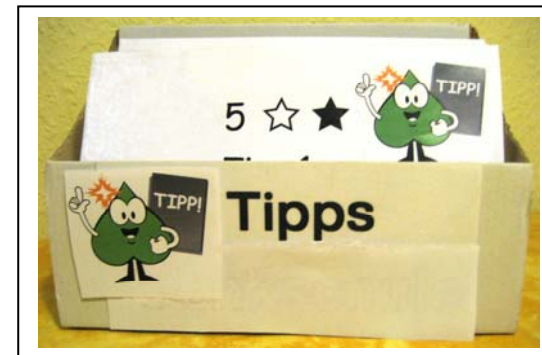
Gefaltete Tipp-Karten im DIN A5 Karteiständer