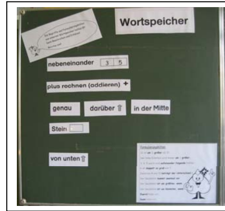
Wortspeicher zur 1. Unterrichtseinheit (S.3/4)

Es gibt einen „Wortspeicher“ (S. 1), der einige einheitliche Benennungen und einige Formulierungshilfen vorgibt. Dieser kann aber auch gemeinsam mit den Kindern erarbeitet werden. Dazu kann ein großes Plakat entstehen, das z.B. an der Tafel hängt und von Einheit zu Einheit ergänzt wird (s. Unterrichtsplanung und Lehrmaterial).