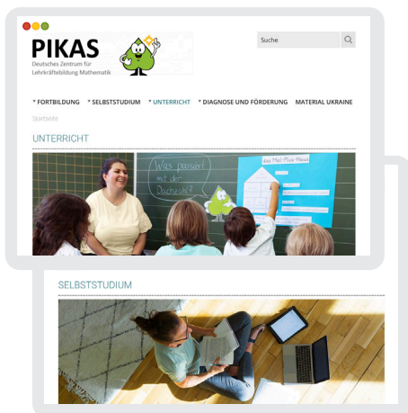
Material für Unterricht und Selbststudium