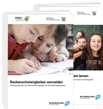
Handreichungen zu den Fokusthemen