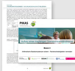
Material zur Fachberatungs- und Fachkonferenzarbeit